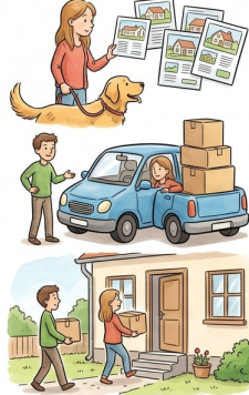
Brother with a Car and the House Search