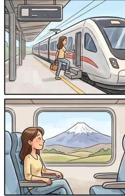
Chapter 2: Mia's Journey