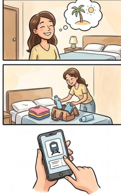
Chapter 1: Mia's Preparation