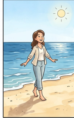
Chapter 3: Mia at the Sea