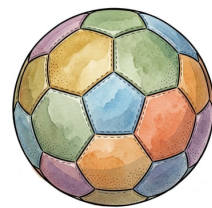
Ein bunter Fußball